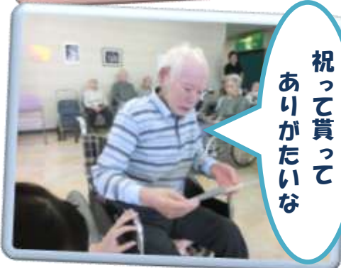
祝って貰って ありがたいな