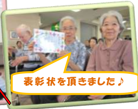
表彰状を頂きました♪