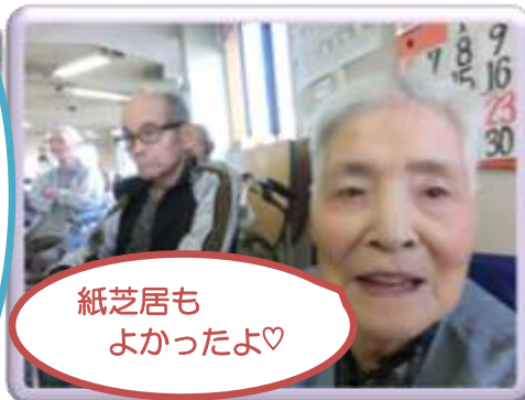
紙芝居も よかったよ♡