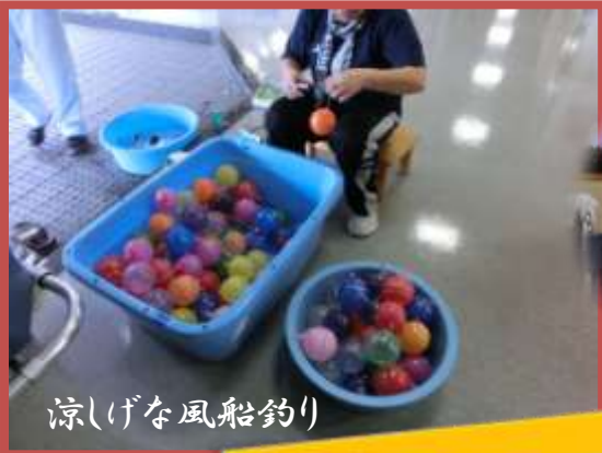
涼しげな風船釣り

美味しいスイカが振る舞われ、職員も浴衣姿で場を盛り上げました。皆で会津磐梯山の盆踊りもして楽しみました。ゲームは施設の中に設けた射的、輪投げ、水風船釣りのお店を巡って景品をイタダキ！楽しかった1日でした。