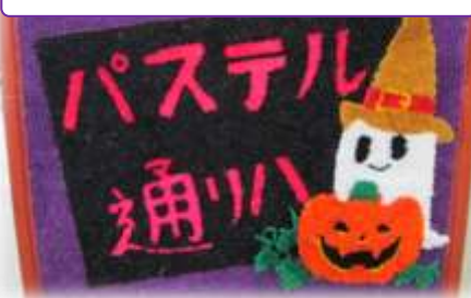
通所リハビリ作「ハロウィン」