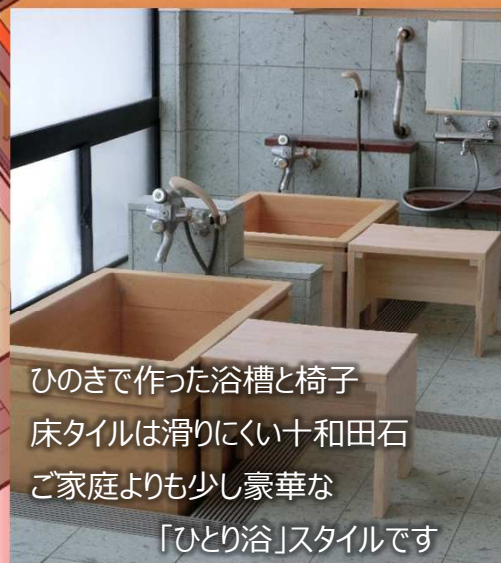
ひのきで作った浴槽と椅子 床タイルは滑りにくい十和田石 ご家庭よりも少し豪華な 「ひとり浴」スタイルです

施設職員が設計に細部まで関わり、高齢者や障害者の方々に使い勝手の良いお風呂に生まれ変わりました。 喜多方の蔵をモチーフにし、ふんだんに使った木の香りがお楽しみいただけます。 是非一度、ご覧にお越しください。