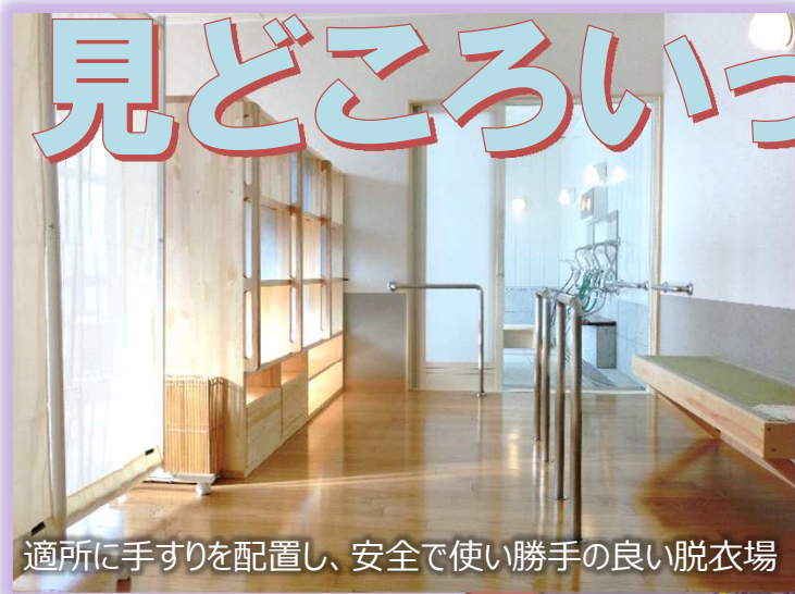
適所に手すりを配置し、安全で使い勝手の良い脱衣場