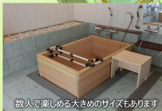
数人で楽しめる大きめのサイズもあります