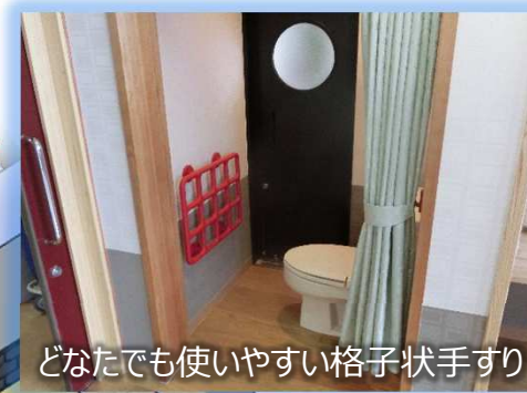
どなたでも使いやすい格子状手すり