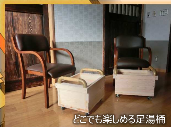
どこでも楽しめる足湯桶