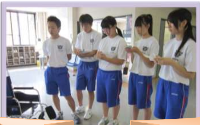
「喜多方第三中学校の皆さん」 楽しい介護を見て行ってね！